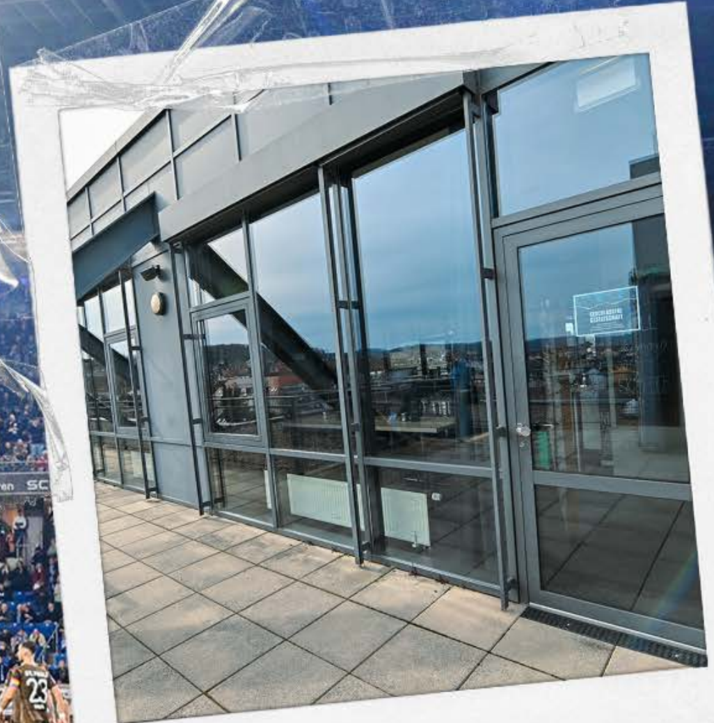
ZUGANG ZUR LOGE