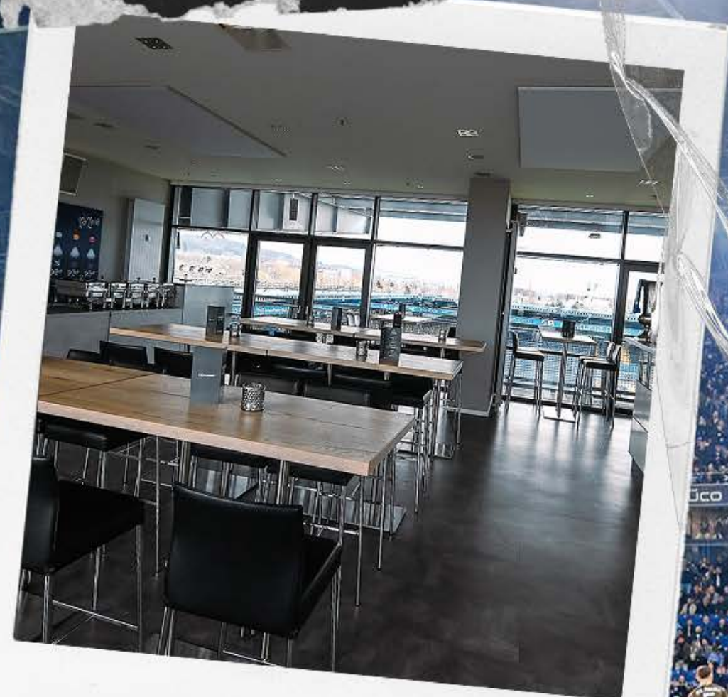
BLICK IN DIE LOGE