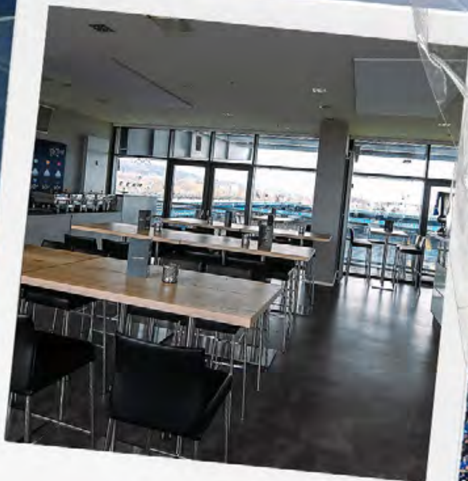
BLICK IN DIE LOGE